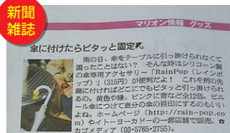
2011年3月10日付 朝日新聞(夕刊)