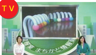
2011年6月6日放送 NHK「おはよう日本」